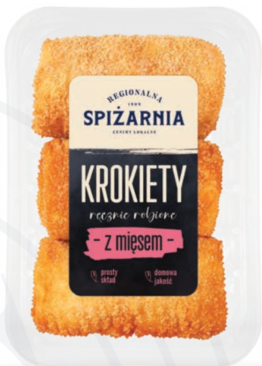
Krokiety z mięsem