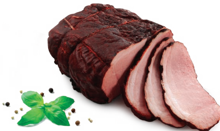
Szynka jak u gospodarza