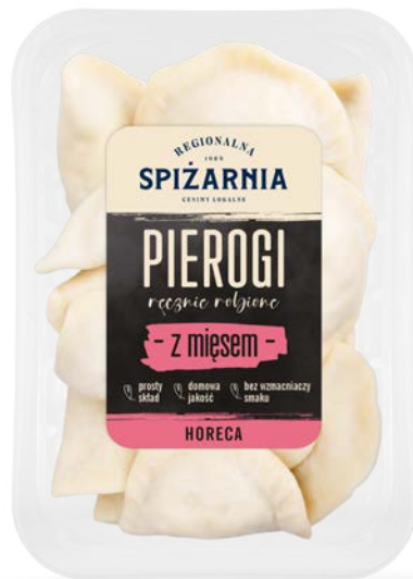
Pierogi z mięsem