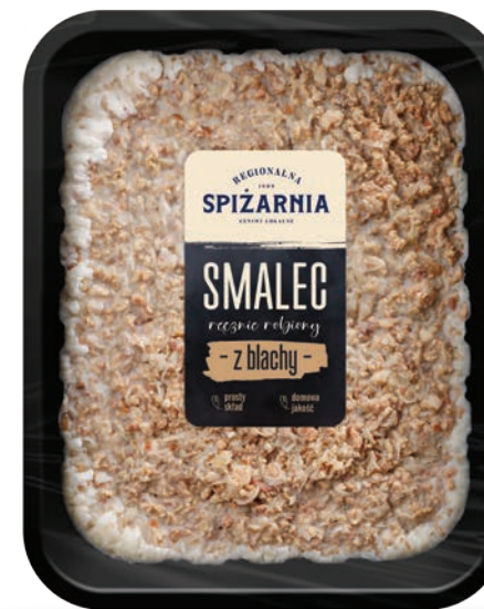
Smalec z blachy