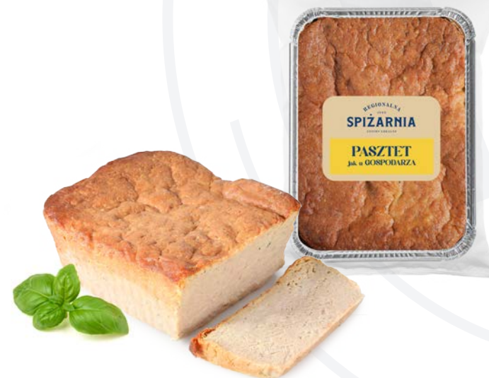
Paszтет jak u gospodarza