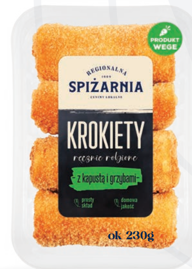
Krokiety z kapustą i grzybami