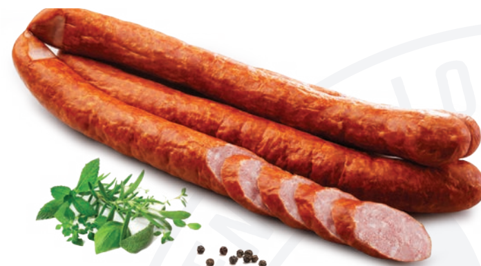
Kielbasa jak u gospodarza jasna