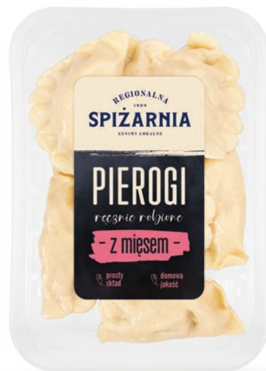
Pierogi z mięsem