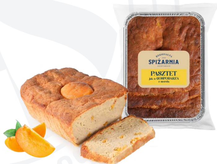
Pasztet jak u gospodarza z morelą