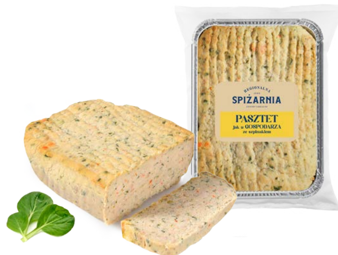
Pasztet jak u gospodarza ze szpinakiem