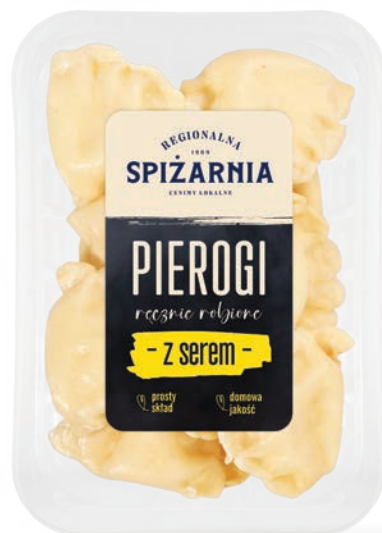
Pierogi z serem