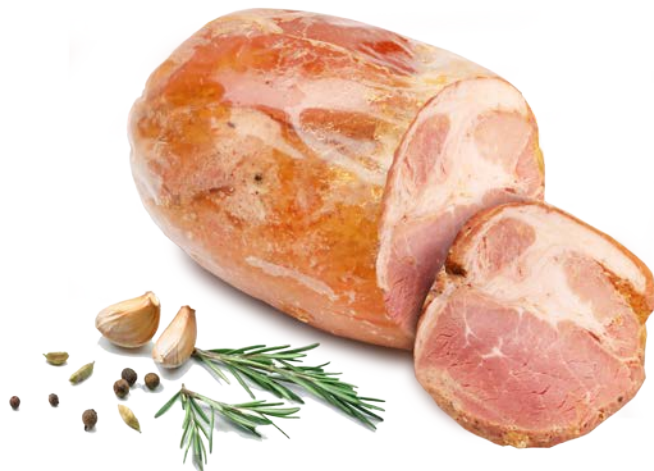
Golonko jak u gospodarza

REGIONALNA 1989 SPIŻARNIA CENIMY LOKALNE