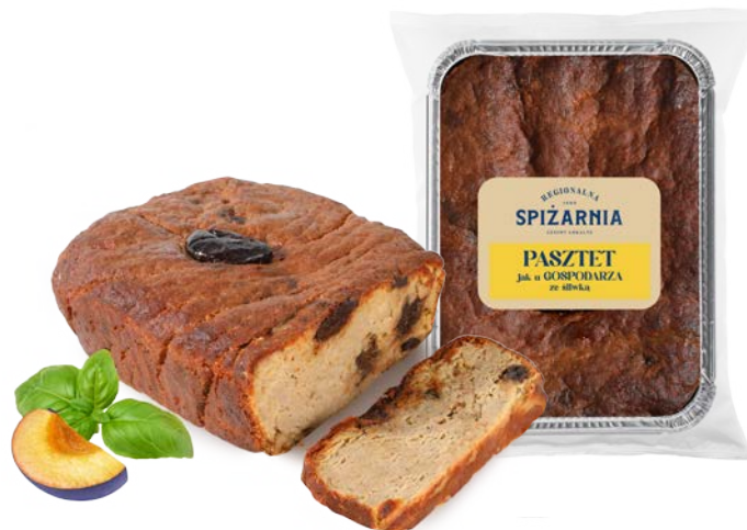
Pasztet jak u gospodarza ze śliwką