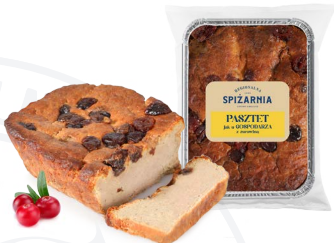
Pasztet jak u gospodarza z żurawiną