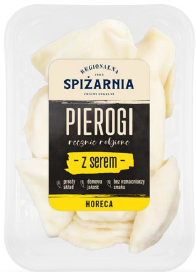
Pierogi z serem