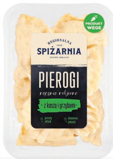
Pierogi z kaszą i grzybami