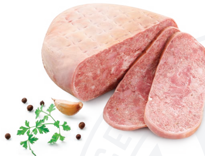
Salceson z regionalnej spizarni