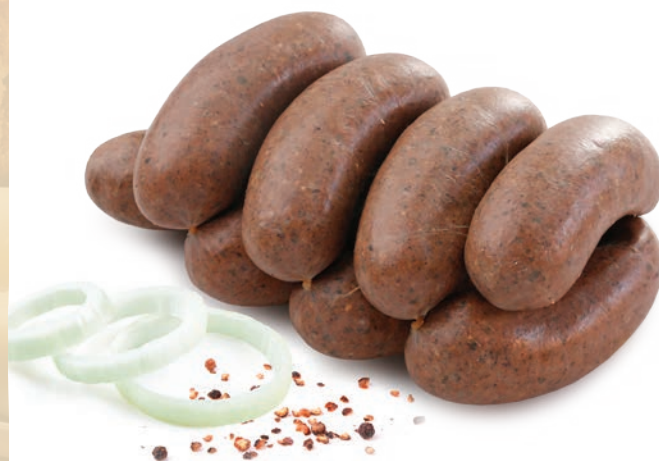
Kaszanka jak u gospodarza z wątróbką