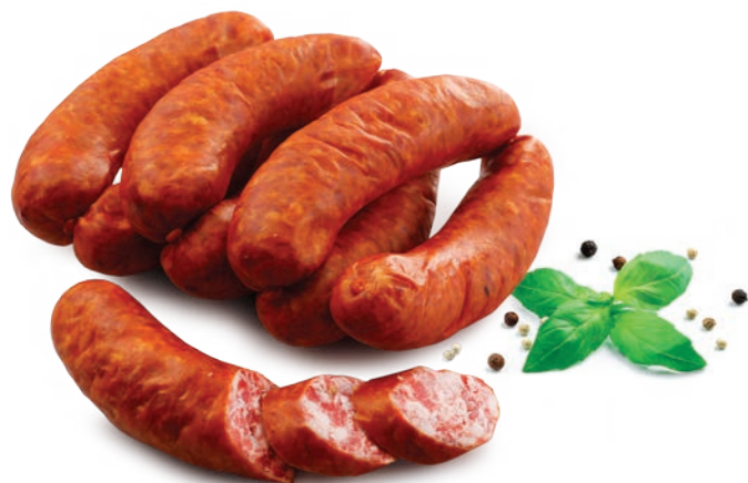
Kielbasa polska wędzona