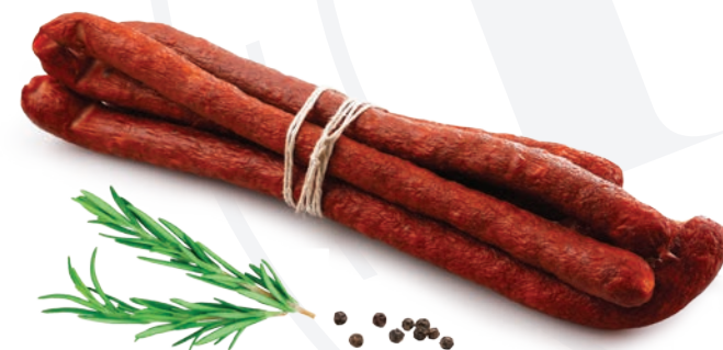
Kabanosy jak u gospodarza