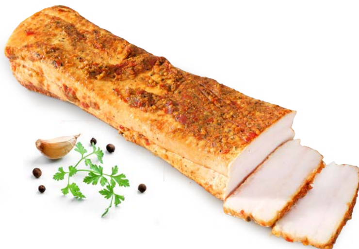
Przysmak jak u gospodarza