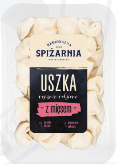
Uszka z mięsem