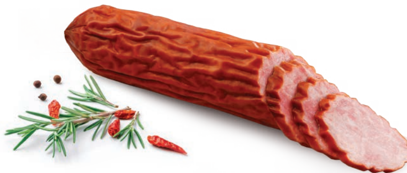
Kielbasa krakowska z indyka