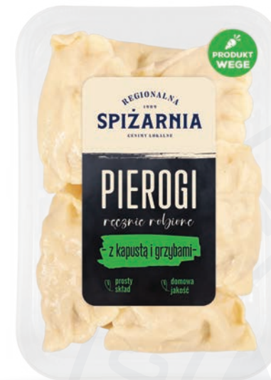
Pierogi z kapustą i grzybami