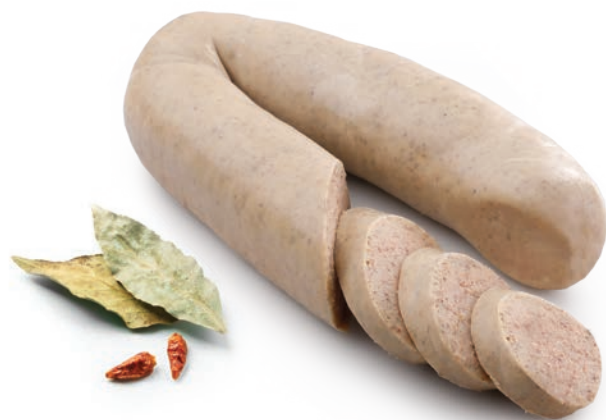
Paszetowa jak u gospodarza

REGIONALNA 1989 SPIŻARNIA CENIMY LOKALNE