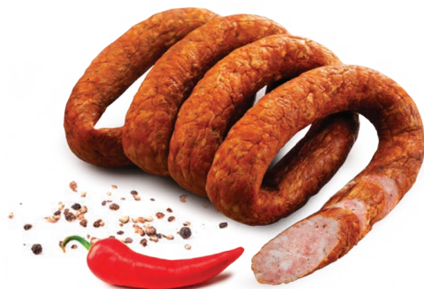
Kielbasa jak u gospodarza ciemna

REGIONALNA 1989 SPIŻARNIA CENIMY LOKALNE