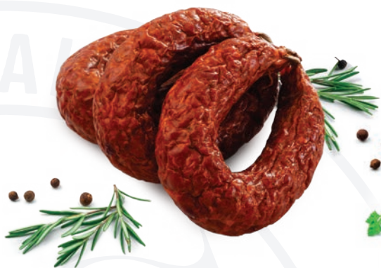
Kielbasa jałowcowa jak u gospodarza