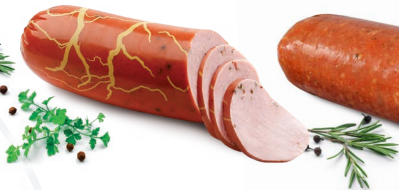
Dębicka z pieprzem